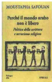
Moustapha Safouan Perché il mondo arabo non è libero. Politica della scrittura e terrorismo religioso Spirali, Milano, pagg. 224, € 30,00